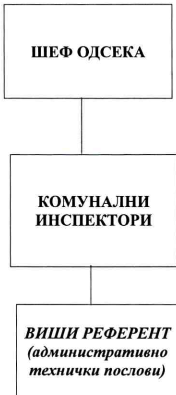
Табела 1. Број расположивих службенка за спровођење инспекцијских надзора и службених контрола у Сектору комуналне инспекције, Одсек за контролу и заштиту јавних зелених површина