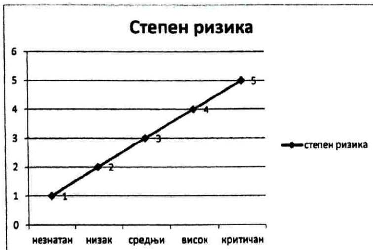
Табела 3. Степен ризика је приказан у контролним листама на сајту: www.novisad.rs/docs које користи Сектор инспекције за саобраћај и путеве Града Новог Сада.