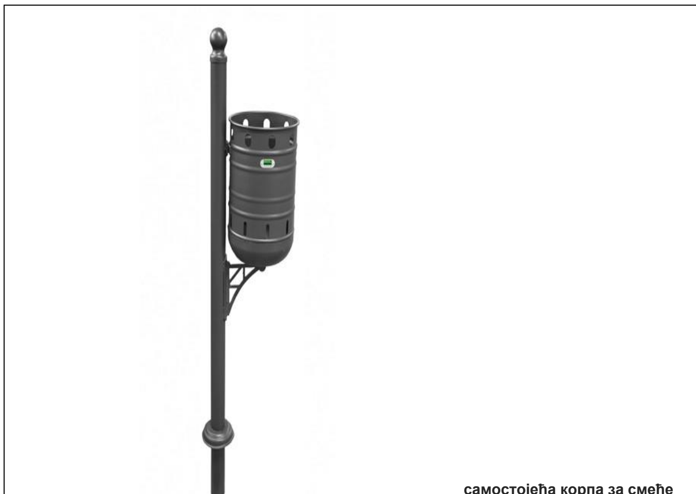
самостојећа корпа за смеће