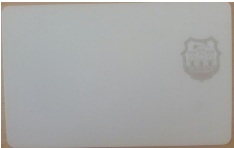
Слика број 1.

Предња страна картица – садржи лого Града Новог Сада (сребрне боје)