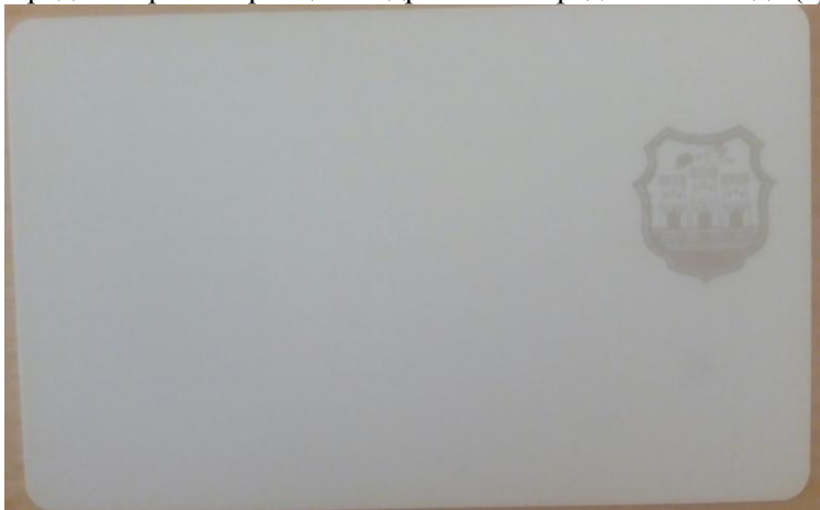
Слика број 3.

Предња страна картица – садржи лого Града Новог Сада (сребрне боје)