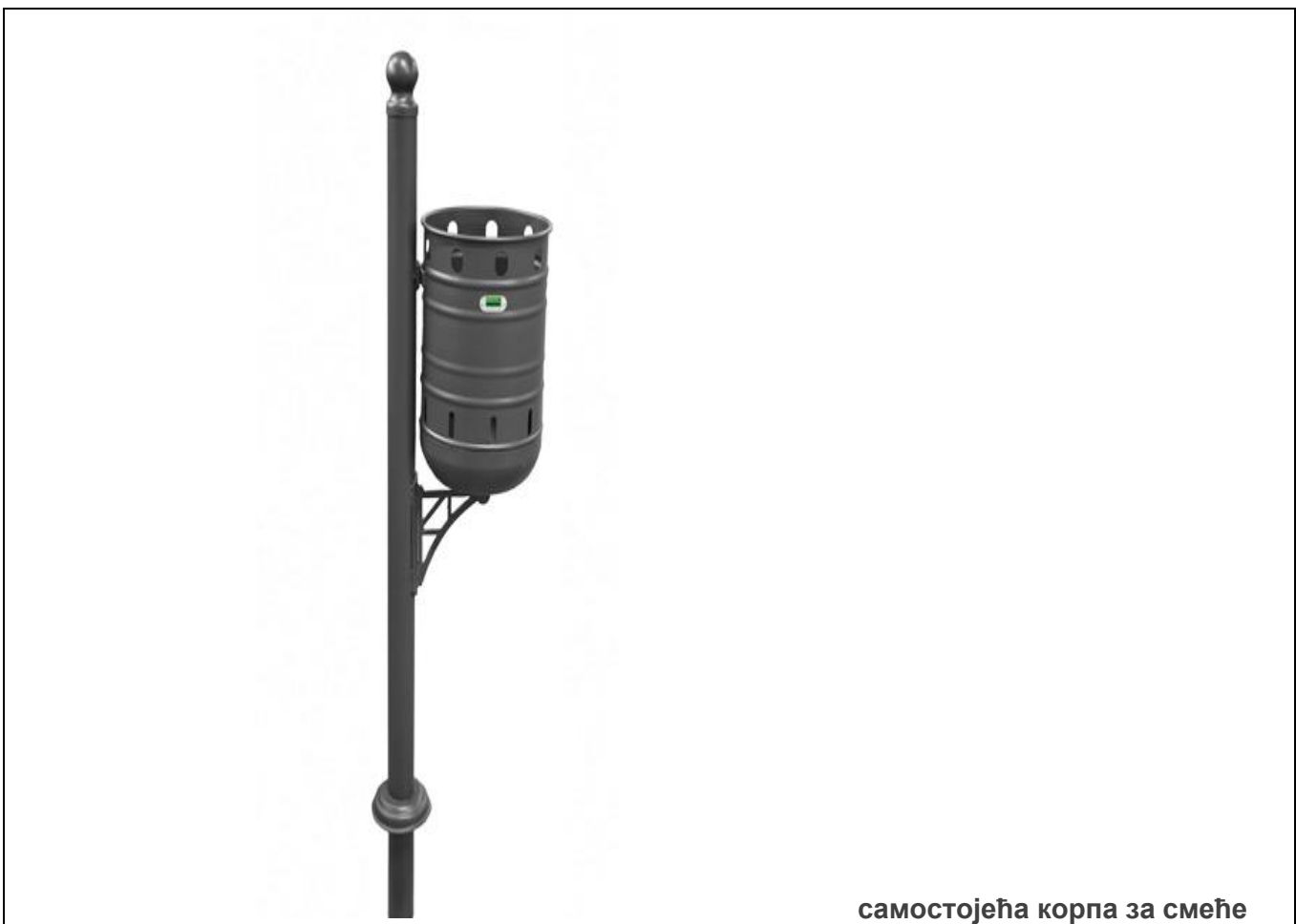
самостојећа корпа за смеће