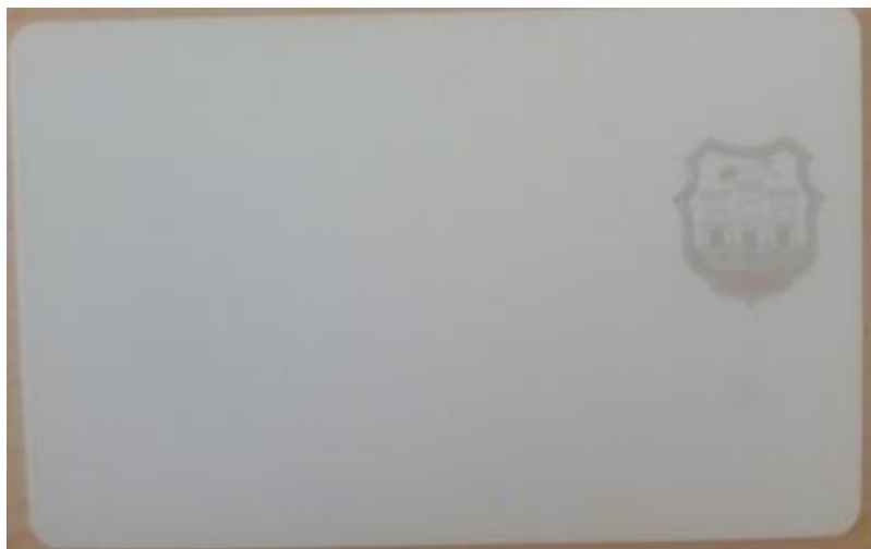
Слика број 2: Задња страна картице за штампање такси – легитимација возача