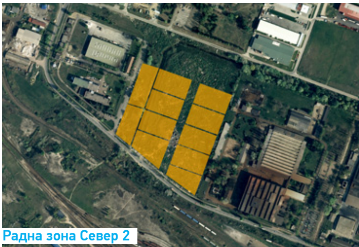
Радна зона Север 2

Гринфилд: 6ha, 70 парцела – могућност спајања, 50евра/ m^2 почетна цена на јавној аукцији