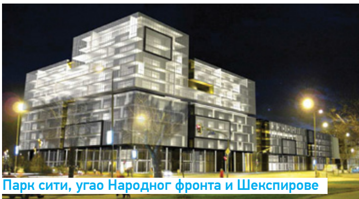
Парк сити, угао Народног фронта и Шекспирове

Гринфилд: 6ha, 70 парцела – могућност спајања, 50евра/ m^2 почетна цена на јавној аукцији