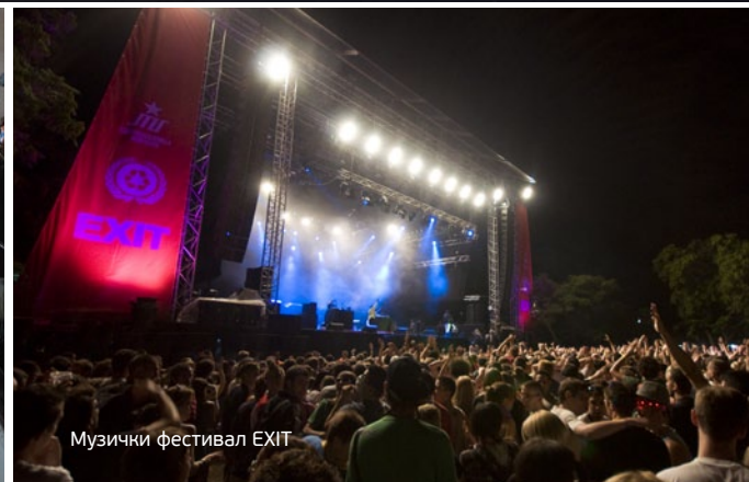
Музички фестивал EXIT