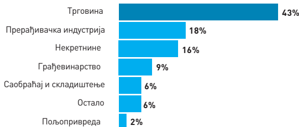
Структура предузетничких радњи по секторима делатност, 2006.