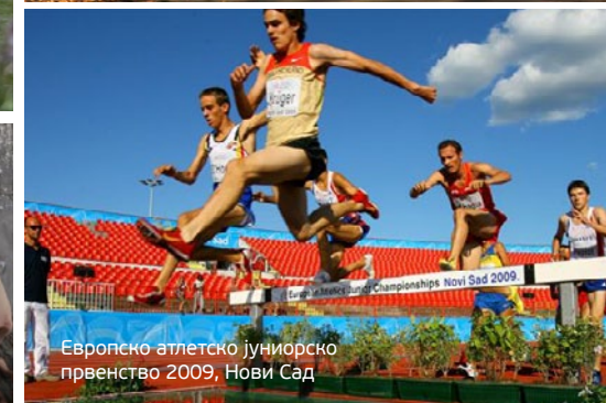
Европско атлетско јуниорско првенство 2009, Нови Сад