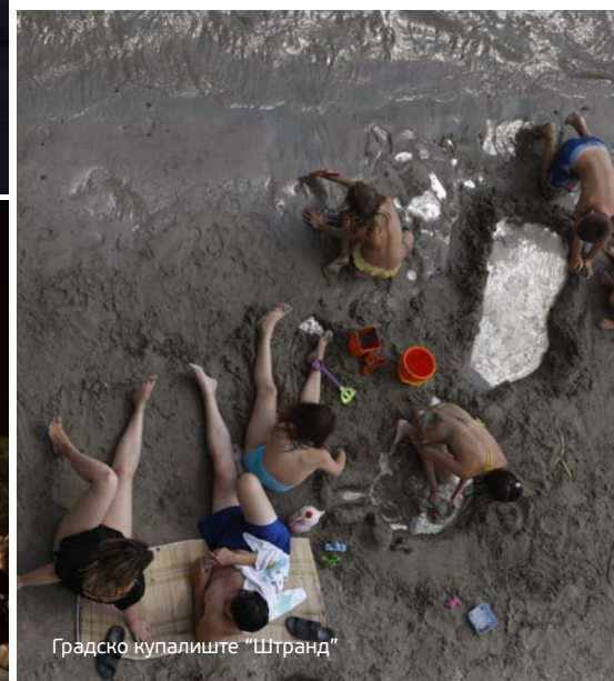
Градско купалиште "Шtrand"