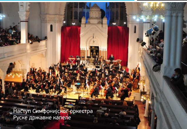
Наступ Симфонијског оркестра Руске државне капеле